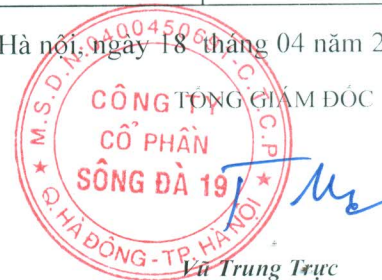
Lư Trung Trực